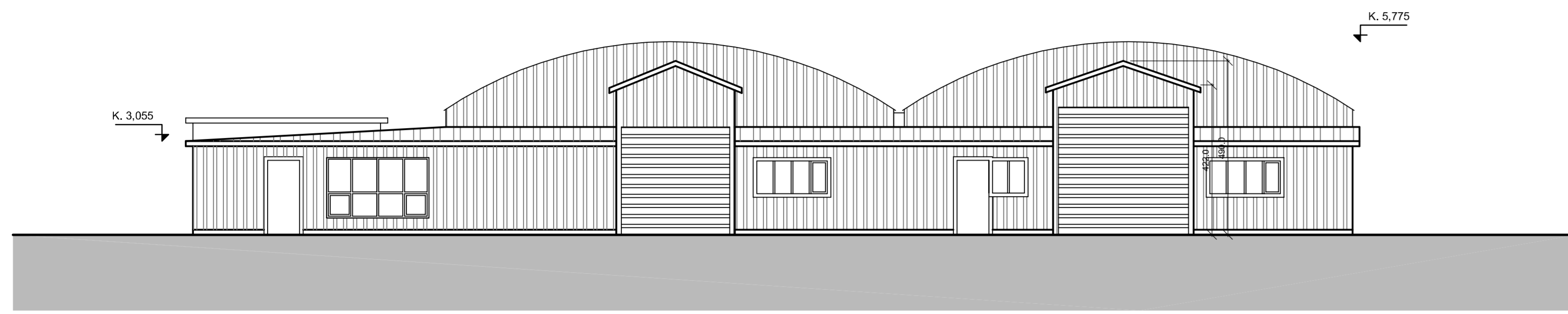
ÚTLIT SUÐUR, mkv: 1:100