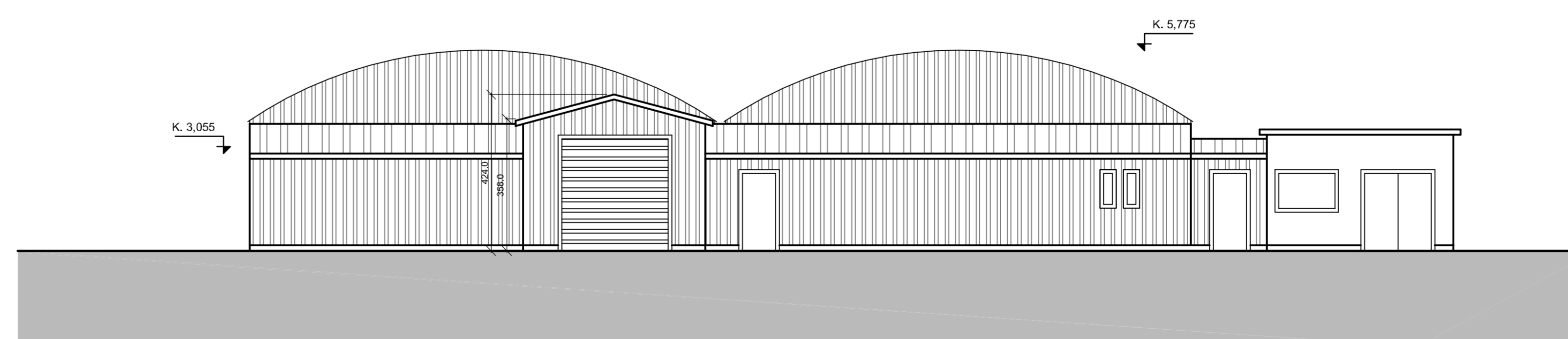
ÚTLIT NORÐUR, mkv: 1:100

Suðurbraut 890 - 235 Reykjanesbær MHL 01 Lanínúmer: 222 926 Staðgreinir: 2060-0-08008900 Stærð lóðar: 8796 m 2